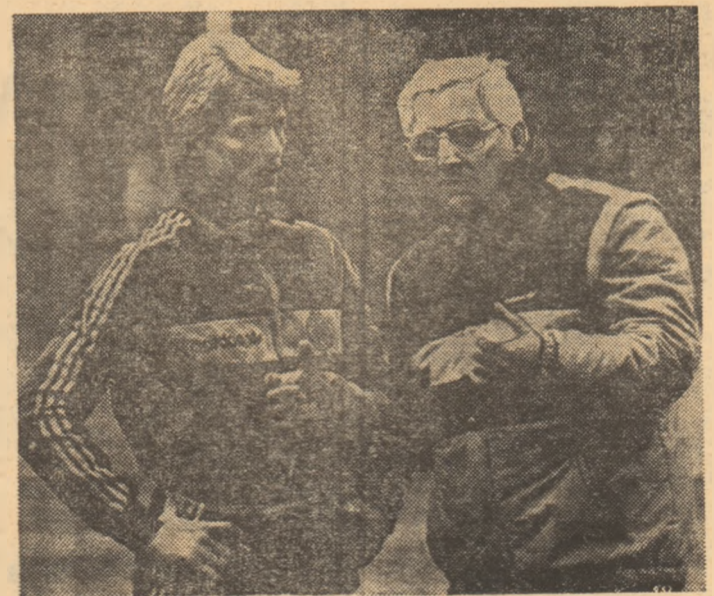
Jupp Derwall într-o conversație cu experimentatul Karl-Heinz Förster, înaintea meciului cu Franța

face și el un test cu tinerii săi jucători alături de vedetele consacrate. Din galeria acestor valoroși fotbaliști va lipsi însă cel mai bun, celebrul Platini (reținut de clubul său, Juventus Torino).