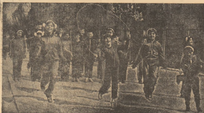
Gimnastica ritmică a rămas — și în trimestrul care s-a încheiat — una dintre preferințele sportive ale elevelor, în întreaga țară...