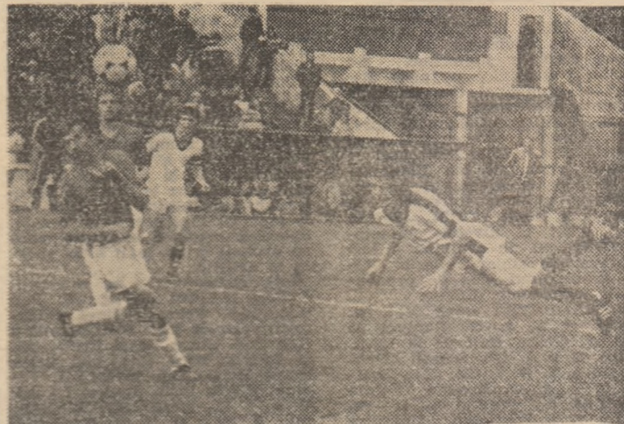
Atac al rapidiștilor la poarta lui Varo. În plonjon — Rada. (Imagine din partida Rapid — A.S.A., 1-1)

năpustit cu toată vigoarea tinereții sale nu prea controlate, probînd mari resurse de energie. De partea cealaltă, un Corvinul închegat, cu o anume