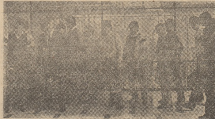
Fotbaliștii din Liverpool, la câteva minute după sosirea de aseară, pe aeroportul București — Otopeni.

astăzi, în fața veritabilei selecționate de internaționali englezi, scoțieni, irlandezi și galezi, care este F.C. Liver-