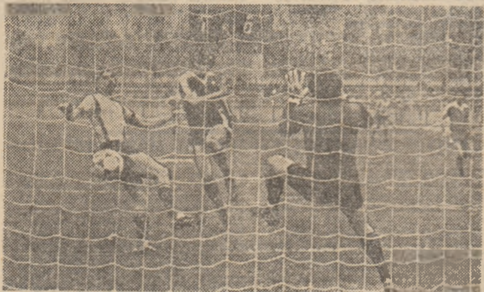
Iamandi, venit în viteză la centrarea lui Țălnar, reia imparable în plasa porții lui Homan. Fază din meciul Dinamo - Jiul 6-2.

namoviști, a căror forță de joc în acest sfîrșit de sezon competițional intern se menține aproape de nivelul demonstrat în recentele lui concluzente