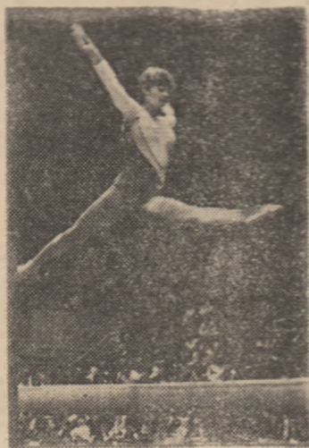
Precis, plin de grație, impecabil, așa a fost și ultimul exercițiu la birnă executat de marea noastră campioană

Ieri, într-o frumoasă și călduroasă zi de mai, la Palatul Sporturilor și Culturii din Capitală a domnit din nou o atmosferă sportivă sărbătorească. Mii de spectatori prezenți au urmărit cu mult interes, timp de aproape patru ore, a gală de gimnastică de înaltă ținută, aplaudind exerciții spectaculoase, executate de reputați maestri ai gimnasticii mondiale. Nadia Comăneci, multiplă campioană olimpică, mondială și europeană, cea mai strălucită reprezentantă a școlii românești de gimnastică, sportivă care a influențat considerabil dezvoltarea acestui sport în țara noastră și în întreaga lume, a evoluat pentru ultima oară în fața publicului care a iubit-o și aplaudat-o întotdeauna cu căldură și entuziasm.