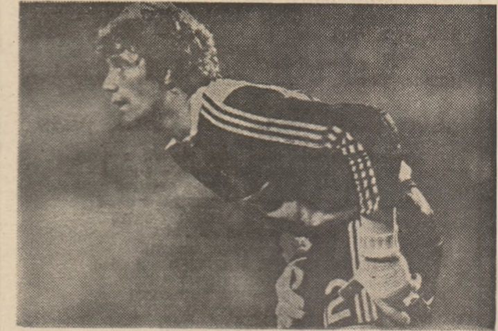
Jean-Marie Pfaff (acum la Bayern München, a fost la Standard Liège), în vîrstă de 30 de ani, de 39 de ori internațional, este unul din jucătorii de bază ai reprezentativei Belgiei. El este considerat printre cei mai buni portari din Europa

U.R.S.S. (et. 11). T.S.K.A. Moscova — Harkov 1-3, Alma Ata — Dniepropetrovsk 1-2, Jalghiris — Dinamo Tbilisi 1-1, Dinamo Minsk — Erevan 1-0, Odessa — Spartak Moscova 1-0, Torpedo Moscova — Sahtior Doneck 1-0, Zenit — Baku 4-1, Rostov — Tskent 2-2, Dinamo Kiev — Dinamo Moscova 2-1. Pe primele locuri: Dniepropetrovsk 15 p., Torpedo, Spartak (un joc mai putin) si Dinamo Minsk cite 14 p. Pe ultimele: 16-18: Baku, Dinamo Moscova, Taskent cite 6. IUGOSLAVIA (et. 33 — penultima). Tuzla — Partizan 1-1, Hajduk — Rijeka 0-0, Titograd — Vinkovici 2-2, Zelenicear — Pristina 4-2, Nis — Dinamo Zagreb 3-2, Mostar — Ljubljana 0-1, Steaua rosie — Novi Sad 1-0, Skopje — Sarajevo 4-3, Osijek — Zenica 5-0. Pe primele locuri: Steaua rosie 43 p., Partizan 42 p., Zelenicear si Rijeka cite 40 p., Hajduk 39 p. Pe ultimele: 16. Dinamo Zagreb 29 p., 17. Ljubljana 28 p., 18. Zenica 22 p. R.D. GERMANA. Finala Cupei: Dynamo Dresden — Dynamo Berlin 2-1 (0-0). AUSTRIA (et. 29). Wiener S.C.