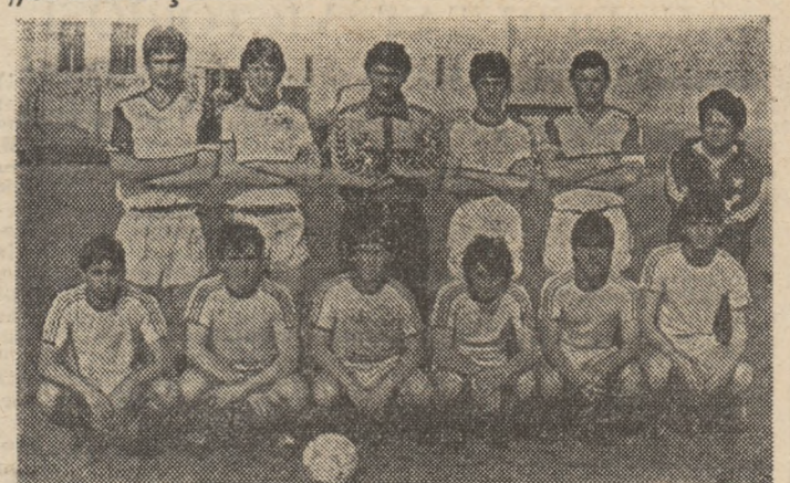
Iată „11”-le de bază al cîștigătorilor campionatului

O dată cu partida de la Tg. Mures, dintre A.S.A. și Dinamo, s-a încheiat și întrecerea speranțelor. Dar să reamintim mai întâi rezultatele partidelor restantă: Steaua — Dinamo 3-0, F. C. Baia Mare — Universitatea 1-0, Universitatea — A.S.A. 6-4, Dinamo — F. C. Arges 2-1, F. C. Arges — Universitatea 2-0 și A.S.A. — Dinamo 3-1. În urma acestor rezultate clasamentul final se prezintă astfel: