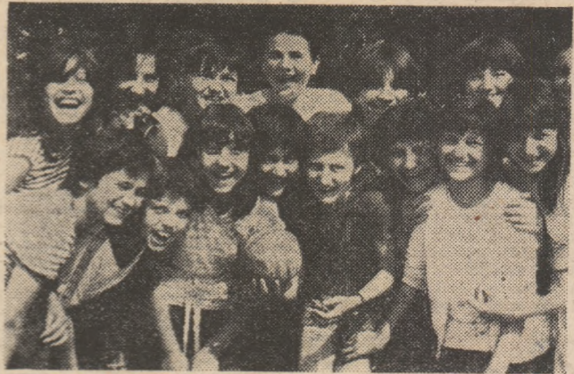
O clipă de răgaz, pentru o fotografie cu... zimbete și ne-lipsita minge. Apoi, din nou, la joacă, la sport...

În preajma sărbătoririi Zilei copilului în întreaga țară au fost organizate acțiuni și întreceri dedicate celor mai mici iubitori de sport.