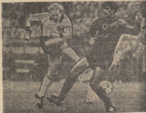
K.H. Rummenigge (se vede în mijloc), în mijloc, în meciul din preliminariile C.E. cu Albania

● Absența lui Schuster provoacă o criză a liniei de mijlocși ● Modificări de „ultimă oră” în lotul pentru Franța ● Încă nu s-a cristalizat „unsprezecele” de start