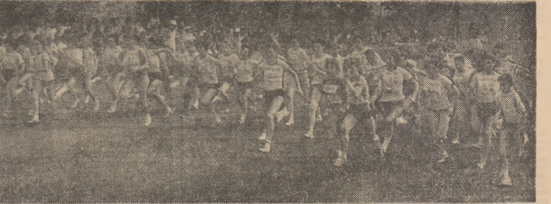
Participare impresionantă la una din întrecerile „Daciadei”