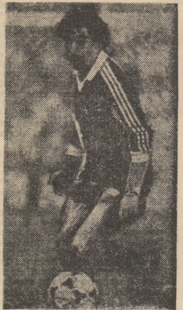
Chalana, unul dintre oamenii de bază ai reprezentativei Portugaliei

Acționa sînt citeva dintre ecourile venite din tabăra portugheză, care, așa cum subliniam, a pre-