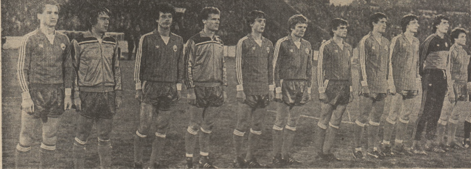
„Tricolorii” la Bratislava, ultima escală în drumul lor spre turneul din Franța