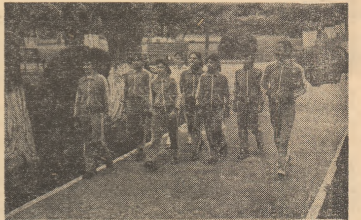
Antrenamentele în sală sînt imbinat adesea cu pregătirea în aer liber