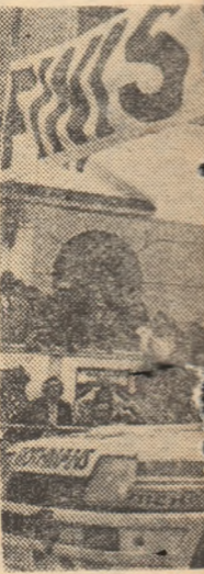
Moment fericit: gătoria „Raliului” dari (Ungaria), de

Miine, din Sibiu, într-o imposibilă competiție automobilistică, „Raliul” ajunsă la cea de-a... Este o întrecere... mă cu 20 de ani... rile automobiliste... țării dunărene (A... Germania, Româ... rior) au decis să... forțurile pentru... competiție care... racterul ei sport... buie la stringere... prietenilor decît... respective, la o... noaștere recipro... varea turismului.