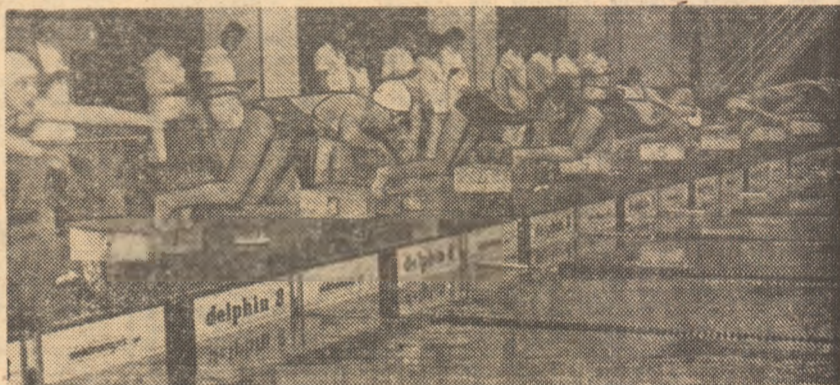
In bazinul de dimensiuni olimpice din Reșița concursurile se desfășoară aproape fără întrerupere