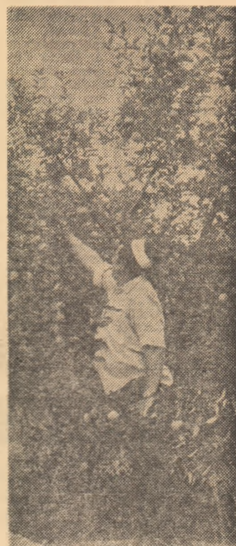
În vîrstă C.A.P. Becicherecul Mic, „cîntîrînd” recolta de mere