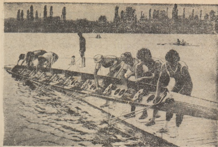
La Baza nouă, pe pontonul albit de ape