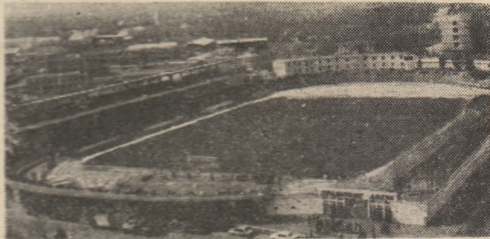
Stadionul „Arenă” din Suceava — gazdă primitoare a numeroșilor întreceri sportive.

pe larg cu persoane cu atribuții în mișcarea sportivă județeană, am consultat documente ale