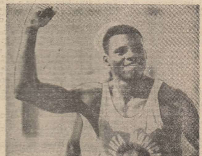
Carl Lewis, tipu campion mondial la Helsinki, dorește să egaleze recordul de vitorii atletice al lui Jesse Owens și să câștige medalie de aur la 100 m, 200 m, lungime și 4 X 100 m.