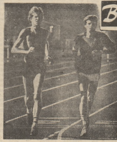
Un cuplu inedit la un antrenament, la Los Angeles: neo-zeelandezul Walker și englezul Coe, adică ultimii doi campioni olimpici ai cursei de 1500 m, primul la Montreal 1976 (3:39,17), al doilea la Moscova 1980 (3:38,4).