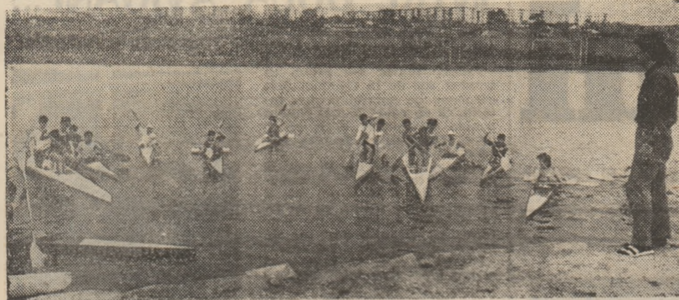
De la zori și până-n seară, apele lacului Cătușa sînt brăzdate de caiacele și canoalele tinerilor gălățeni care visează să ajungă în „flotila de aur” a țării...