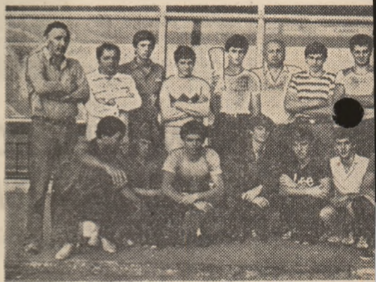
Echipe de polo, cîștigătoare a „Cupei Priet

La inot, ca și în atletism, cifrele îți pot da dreptul la speranțe. Dar la jocuri sportive, situația e altfel. Spre pildă, la polo. Într-un moment în care rezultatele slabe ale polo-