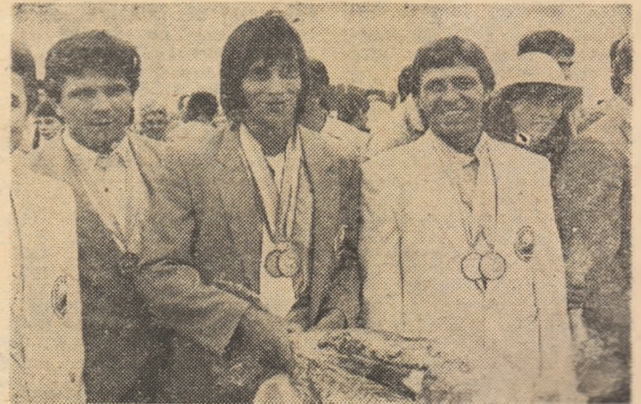
Trei bravi sportivi, trei campioni olimpici — Ion Drăgă, Ion Paizachin, Toma Simionov — reprezentanți a trei cluburi (Farul Constanța, Dinamo, Steaua), reprezentanți străluciți ai sportului românesc

Ecaterina Szabo are un veritabil colan de medalii de aur, cucerite prin talent și muncă, distincții care îmbogățesc prețiosul tezaur al gimnasticii românești. „Sint fericită că am