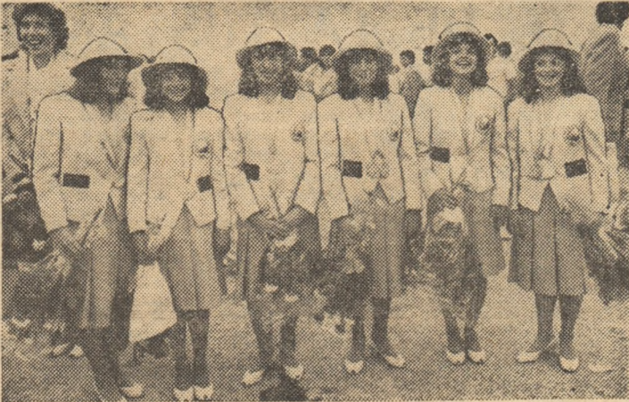
Șase fete, o echipă de aur, demonstrînd strălucit resursele gimnasticii din țara noastră

Nicu Vlad, băiatul descoperit cu 5 ani în urmă de maestrul Gh. Gospodinov lângă „drumul fără pulbere” al Dunării, un Hercule... modern, își poartă cu mîndrie medalia de aur cucerită în întrecerea olimpică a halterofililor dar ochii îi sînt u-