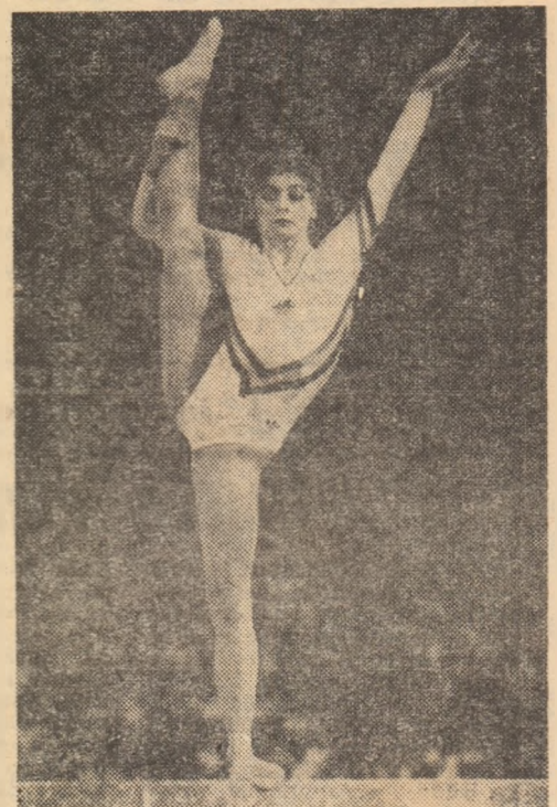
Ecaterina Szabo în timpul exercițiului la birnă.

Comentînd desfășurarea primului concurs olimpic de gimnastică ritmică, agențiile internaționale de presă arată că nu-