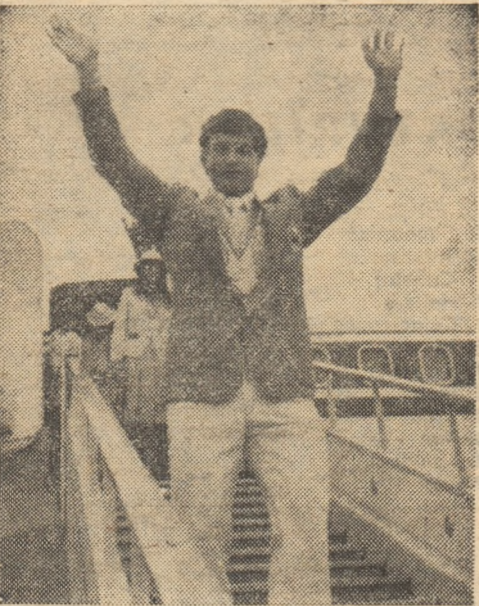
Victorie! Nicu Vlad, halterofilul campion olimpic al trei recorduri ale J.O., răspunde fericit aplauzelor cu care este întâmpinat

— Mare mi-a fost bucuria la prima medalie olimpică de aur, cucerită cînd aveam 18 ani. Dar aceasta, de acum, îmi este și mai dragă, pentru că am obținut-o la o virstă cînd alți sportivi mari s-au retras de mult din activitatea competițională. Sint nespuse de fericit!