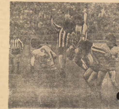
Componentă a „cvartetului fruntaș” Sportul și ea unele „sincop” în trecutul campionat: Petrolul (din care vă prezentăm o fază), pe priu. Deci, atenție la noul campionat!

s-a intimplat cu Politehnica Timișoara, care, mai târziu, avea să piardă cu 0-4 un alt meci, cu Universitatea Craiova; sau Politehnica Iași, care este învinsă de C.F.R. Pașcani - până mai ieri divizionară „C”. Petrolul, retrogradată din „A”, după ce i-a pierdut pe Toma, Bărbulescu și Cirlan, învinge în aceste meciuri de verificare, într-o săptămână, pe Chimia Rm. Vilcea (3-1) și F.C.M. Brașov (2-1). Ce vrea să însemne asta? Care e valoarea? Care e nivelul de pregătire? Un răspuns îl cunoaștem: „Băieții n-au forțat”. O plăcă