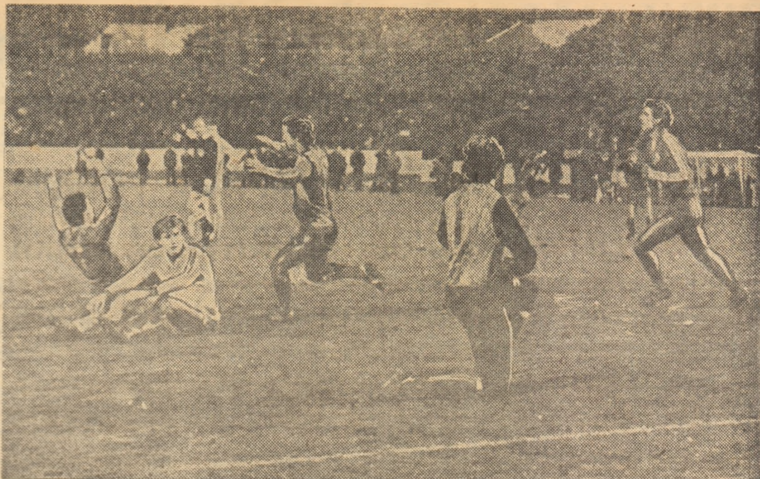
Goool! Bratislava 1983. Tricolorii au câștigat bătălia cea grea cu Italia, Cehoslovacia și Suedia.