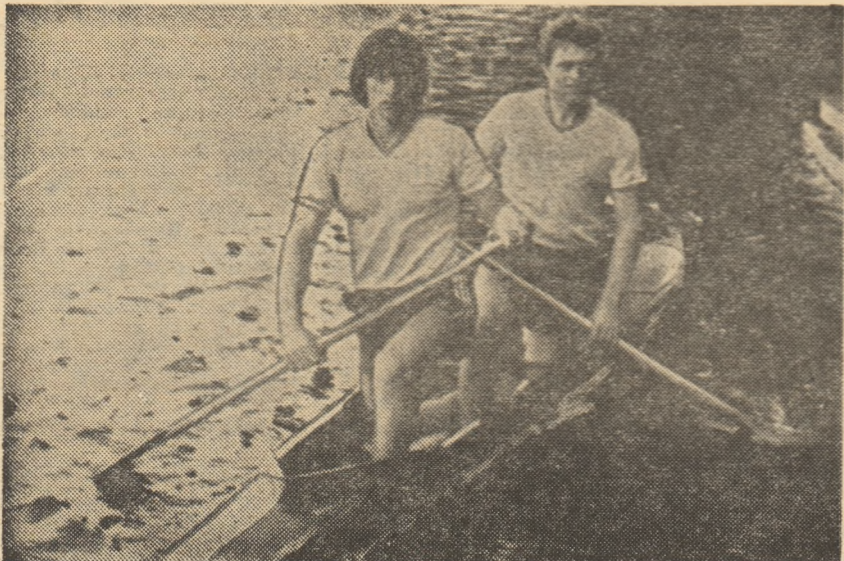
Un model de muncă, tenacitate, dăruire: Ivan Patzaichin, într-o „barcă de aur” împreună cu Toma Simionov

Vom începe cu... perfecțiunea. Cu sportiva care se poate mîndri că a atins perfecțiunea, ținîndu-ne și ținînd lumea întreagă în nopțile Montrealului, ca și după Olimpiada din Canada, cu respirația tăiată, cînd triumfa în lupta cu adversarele, cu propriile limite și cu... computerul. Nadia Comăneci, tînăra crescută, educată și pornită pe drumul muncii îndrăzite, dăruite, totale — singurul care poate duce la izbînda adevărată, trainică — în anii cel mai luminoși ai libertății noastre, înseamnă mai mult decît un mare sportiv, înseamnă un simbol. Iar dovada cea mai de preț a unanimei aprecieri a constituit-o acordarea înaltului titlu de Erou al Muncii Socialiste. „Clipele în care cel mai iubit fiu al poporului, tovarășul NICOLAE CEAUȘESCU, mi-a înmînat înaltele însemne, îmbrățișîndu-mă cu aleasă căldură părintească, mi-au rămas pentru totdeauna întipărite în memorie. Cuvintele sale de apreciere au reprezentat pentru mine, pentru gimnastica noastră, cea mai frumoasă răsplătă”. Sînt spusele celui dintîi Erou al Muncii Socialiste în sport, ale celui mai mare gimnast din cîte au fost și sînt.