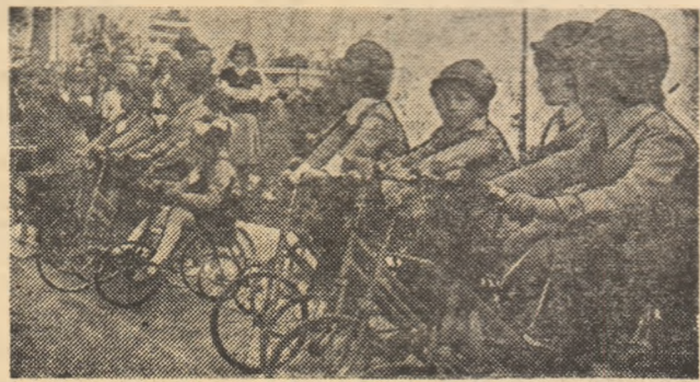
La Sulina, ca pretutindeni, copiii — cei mai entuziaști prieteni ai sportului

Educația fizică nu mai este, nici în programa școlară, nici în mentalitate, o „dexteritate”. Sportul a devenit un obiect, a materia importantă în pregătirea copiilor noștri. În pregătirea lor fizică, dar și în cultivarea unor adevărate însușiri morale și patriotice. În pregătirea lor pentru viață!