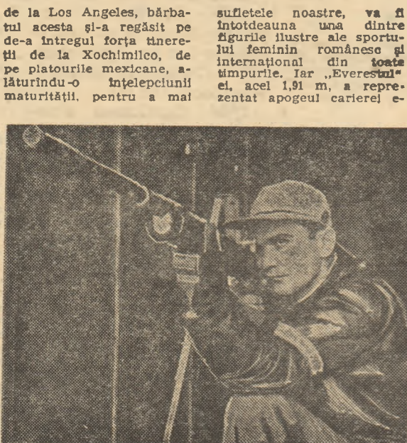
Iosif Sirbu — primul nostru campion olimpic (Helsinki, 1952)

Vom începe cu... perfecțiunea. Cu sportiva care se poate mîndri că a atins perfecțiunea, ținîndu-ne și ținînd lumea întreagă în nopțile Montrealului, ca și după Olimpiada din Canada, cu respirația tăiată, cînd triumfa în lupta cu adversarele, cu propriile limite și cu... computerul. Nadia Comăneci, tînăra crescută, educată și pornită pe drumul muncii îndrăzite, dăruite, totale — singurul care poate duce la izbînda adevărată, trainică — în anii cel mai luminoși ai libertății noastre, înseamnă mai mult decît un mare sportiv, înseamnă un simbol. Iar dovada cea mai de preț a unanimei aprecieri a constituit-o acordarea înaltului titlu de Erou al Muncii Socialiste. „Clipele în care cel mai iubit fiu al poporului, tovarășul NICOLAE CEAUȘESCU, mi-a înmînat înaltele însemne, îmbrățișîndu-mă cu aleasă căldură părintească, mi-au rămas pentru totdeauna întipărite în memorie. Cuvintele sale de apreciere au reprezentat pentru mine, pentru gimnastica noastră, cea mai frumoasă răsplătă”. Sînt spusele celui dintîi Erou al Muncii Socialiste în sport, ale celui mai mare gimnast din cîte au fost și sînt.