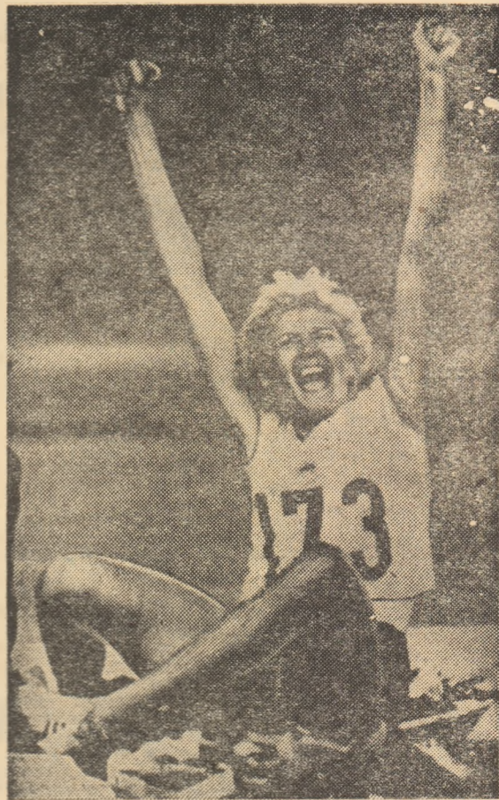
Victorie! Multe asemenea clipe de mare satisfacție ne-a prilejuit Iolanda Balas...

Au crescut sportivi mari în România, au crescut oameni adevărați în sportul românesc. Pentru a putea vorbi despre toți ar trebui zeci, sute, mii de rînduri. Iar dacă o asemenea întreprindere într-o pagină de ziar e, se înțelege, imposibilă, dacă ne vom opri doar asupra citorva nume, o vom face păstrîndu-ne neștirbită admirația și pentru ceilalți performențieri de ieri sau de azi, selecția noastră subiectivă cuprinzînd o seamă dintre campionii cu o activitate avînd puterea exem-