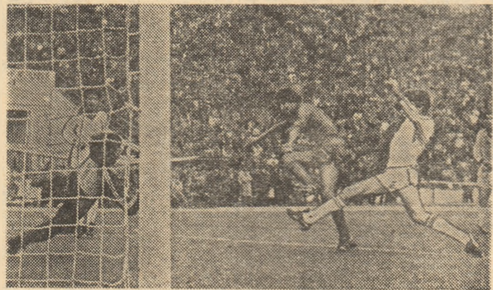
Plusul de combativitate înseamnă a ataca mai mult, iar atacul creează frumoasele faze de poartă, ca aceasta din imaginea de față.

Ce ar putea face campionatul primei Divizii pentru fotbalul nostru în general și pentru echipa națională, adică pen-