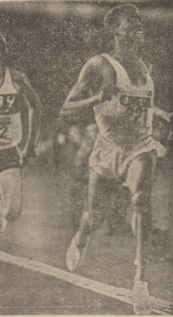
Said Asmita, în dreapta, primul atlet marocan campion olimpic

PRAGA. Marti a avut loc în capitala Cehoslovaciei o reuniune internațională dominată de atleții din R.D. Germană, învingători la majoritatea probelor: femei: 100 m: Ines Schmidt 11,48, 200 m: Dagmar Ruchman 22,87, 400 m: Sabine Busch 30,33, 800 m: Hildegard Ulrich 1:26,53, 1500 m: Ulrike Bruns 4:25,35, 100 mg: Sabine Paiz 12,98, 400 mg: Siguna Ludwig 37,88, lungime: Schmidt 4,66 m, înălțime: Andreea Hlavin 1,96 m, greutate: Margita Puffe 20,15 m, sălă-țită: Petra Felke 73,74 m; bărbați: 100 m: Schröder 10,45, 200 m: Müller 21,29, 400 m: Schönlebe 45,35, 800 m: Busse 1:49,10, 1500 m: Bergmann 3:47,92, 5000 m: Peter 14:01,28, 3000 m obst: Melzer 8:29,46, lungime: Hanacek (Cehoslovacia) 8,02 m, triplu: Elbe 16,23 m, înălțime: Sam 2,31 m, sălă-țită: Kramss 5,20 m, greutate: Sarul (Polonia) 20,00 m, disc: Bugar (Cehoslovacia) 65,36 m, sălă-țită: Gorak (Polonia) 68,10 m.