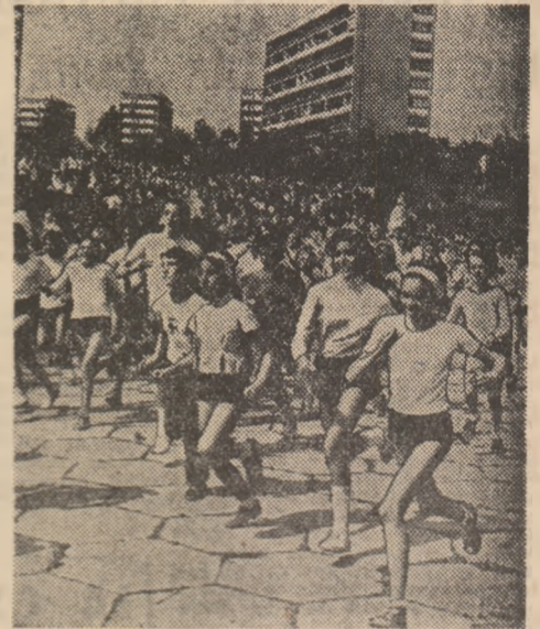
Pe timpul vacanței — prezențe entuziaste în întrecerile de cros. Imagine surprinsă în cartierul Baia Albă din Capitală.