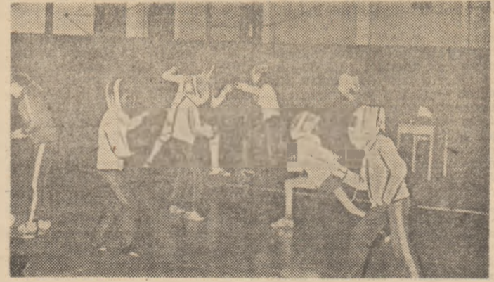
În frumoasa sală de scrimă, „viitorul” floretei sătmărene se pregătește cu asiduitate

Intre aceste unități, un loc important îl ocupă Clubul sportiv școlar, a cărui eficiență s-a demonstrat în dese rânduri, munca și pasiunea colectivului materializîndu-se în realizarea