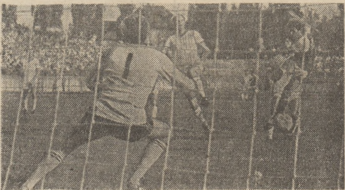
Hagi, pe care îl vedeți înscriind în partida cu Politehnica Iași, demonstrează o formă bună și - lucru de subliniat - o creștere a eficacității. Semne încurajatoare în perspectiva jocurilor echipei naționale și ale Sportului studențesc

Lotul național de fotbal s-a reunit ieri în Capitală. Într-un fel, ieri la prinz, „tricolorii” au început drumul lung și anevoios al noii ediții a Campionatului mondial, al cărui turneu final se va desfășura în vara lui 1986, în Mexic. Dar până atunci vor fi grelele meciuri din preliminarii, fază care pentru echipa națională a României va debuta săptămîna viitoare, mai precis miercuri 12 septembrie, cu partida ce va avea loc la Belfast, în compania reprezentativei Irlandei de Nord.