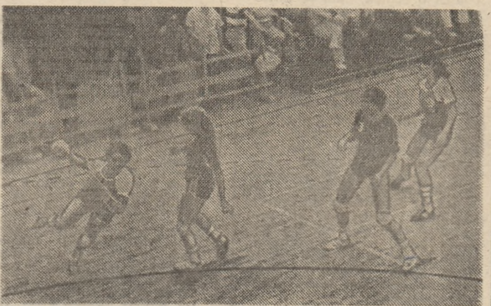
Conduse de multe ori pînă în min. 55 handbalistele de la Progresul (în fotografie în stac) au găsit resurse pentru o victorie meritată.