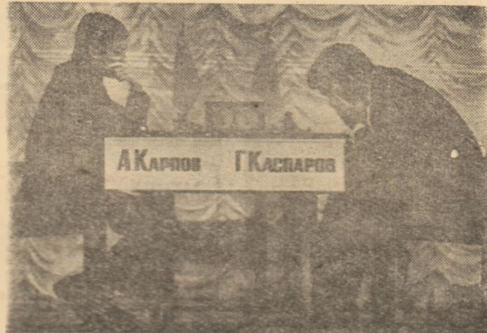
La mutare este Garri Kasparov

Prima partidă a meciului pentru titlul mondial la șah și dat tonul mult așteptatei întâlniri, prin vigoarea și dirzenia cu care au luptat cei doi parteneri.