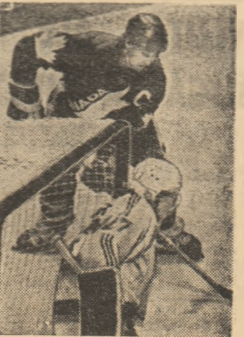
Suedia. În turneul preliminar aceste echipe au mai jucat între ele: U.R.S.S. a întrecut

În semifinalele importantei competiții hocheistice „Cupa Canada” se întîlnesc formațiile U.R.S.S. — Canada și S.U.A. —