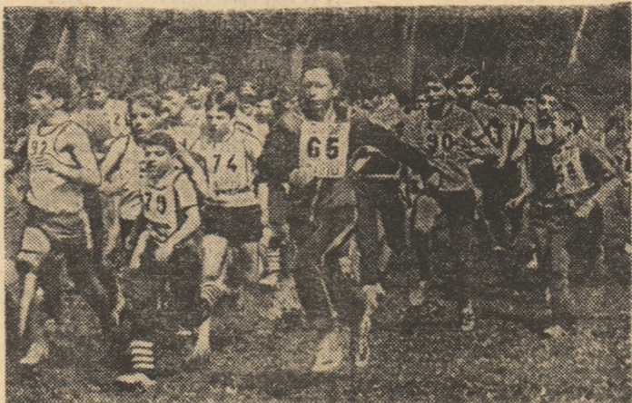
Aspect de la un cros - o disciplină îndrăgită la Bocșa