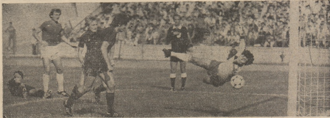
Deși portarul rapidist a „zburat” în poarta sa (cum o face și în această imagine), el nu a putut, totuși, evita înfringerea echipei sale în fața noului lider, Steaua