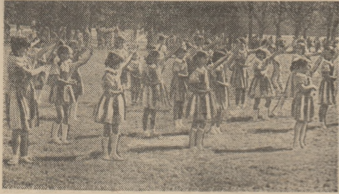
O secvență de la frumoasa festivitate de deschidere a anului sportiv școlar de pe Stadionul Tineretului din Capitală.

— s-a bucurat de o deplină reușită. Prin tradiție, anul sportiv școlar bucureștean l-au deschis gimnaștii și gimnastele cluburilor sportive ale elevilor, printr-o impresionantă repriză condusă de prof. Ioan Sabău, de la C.S.S. „Triumf“. A urmat o cursă ciclistă de eliminare susținută de rutieri juniori ai clu-