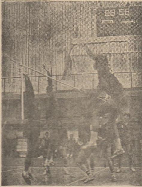
Stelistul Mina nu poate fi sperat în atac de un blocaj dă-mărean tardiv în plasament.

ȘTIINȚA MOTORUL BALIA MARE — C.S.M. CARANSEBES 3-0 (10, 2, 11). Meci la discreția gazdelor, doar setul ultim fiind mai echilibrat.