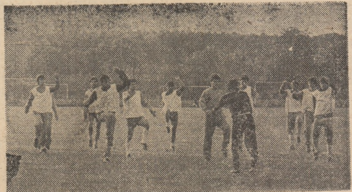
Ultimul antrenament al echipei Dinamo efectuat înaintea plecării la Bordeaux

Partenera Universității Craiova (în manșa I a turului II din cadrul „Cupei U.E.F.A.”), echipa Olympiakos Pireu, a sosit, ieri, la amiază, în localitate, la bordul unui avion care a aterizat direct pe aeroportul din Craiova.