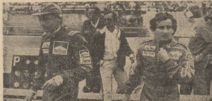
Cei doi piloți, Lauda și Prost, cu câteva clipe înainte de start, îndreptîndu-se spre mașinile lor. Peste aproape două ore se va da... „verdictul”!