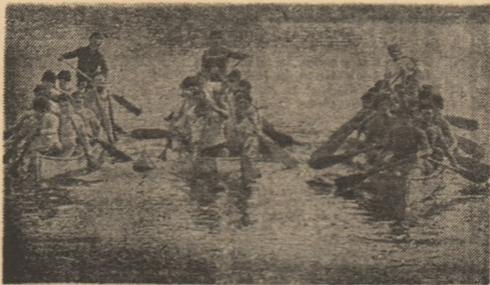
Programul intrecerilor de ieri, de la Complexul cultural-sportiv Tei, a cuprins și străpătoarele curse de canoe 10+1