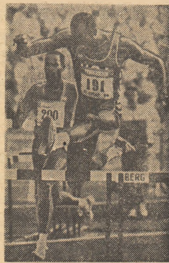
Edwin Moses, recordmanul mondial și campionul olimpic al probei de 400 m.g. — neîn- vins în zece și zece de curse — va câștiga anul viitor și „Marele Premiu al IAAF”?

Recent, un alt sport, poate cel mai frumos și, în mod cert, cel mai complet dintre toate, atletismul, a intrat în această frumoasă și atractivă „horă” a