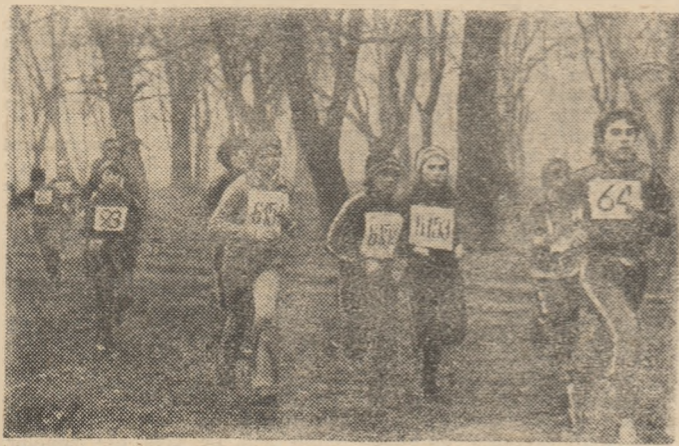
Pe aleile parcului din Călărași, alergările de cros sînt, acum, toamna, la ordinea zilei. Participă nu numai oamenii muncii din noua „Cetate a oțelului“, ci și familiile acestora, copiii lor, cei care — peste ani — vor prelua ștafeta muncii pe marea platformă siderurgică