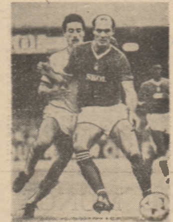
Lui Ian Rush de la F.C. Liverpool i s-a decernat „Gheata de aur” pentru sezonul 1983-84. Iată-l in imagine, barăt de Metgod (in prim-plan) de la Nottingham Forest. Același Ian Rush a înscris trei goluri cu prilejul meciului dintre echipa sa si Benfica (3-1) din cadrul primului joc al turului II al C.C.E.

PARIS, 31 (Agerpres). — La Paris a avut loc marți ceremonia decernării trofeelor instituite