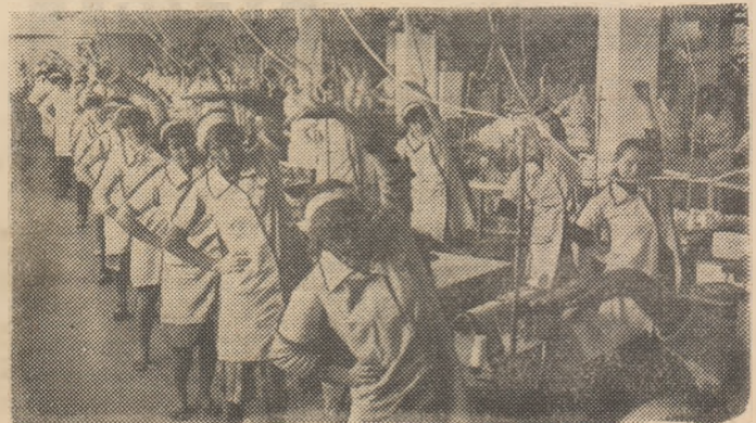
Exercițiul fizic la locul de muncă — o adevărată repriză de sănătate, de refacere a forțelor