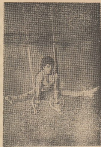
In Ungaria, campionatele pionierilor se desfășoară anual la majoritatea disciplinelor olimpice si se bucură de o mare popularitate.