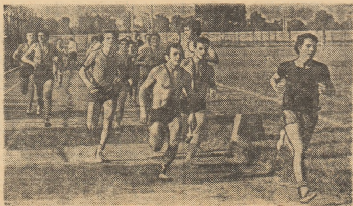
În timpul liber — animate întreceri de cross