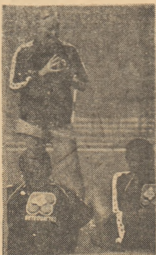
Liedholm explică tema de antrenament jucătorilor de la A.C. Milan. Peste cîteva minute începe munca...

Povestea este veche și credem, destul de cunoscută. Una din marile echipe ale lui „Il calcio”, A.C. Milan, cam dispăruse în ultimii ani din „malta societății” a fotbalului peninsular. De două ori a retrogradat în seria secundă (o