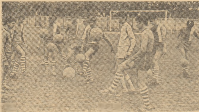
Oare cîți dintre ei vor reuși să urce treptele performanței?