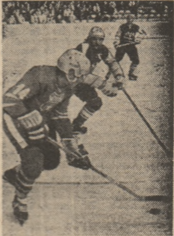
În prim-plan, impetuosul atacant stelist Traian Cazacu

Astăzi, de la ora 18, iubitorii hocheiului din Galați (sperăm să vină cât mai mulți la patinoar), vor avea ocazia să fie martorii unui joc de