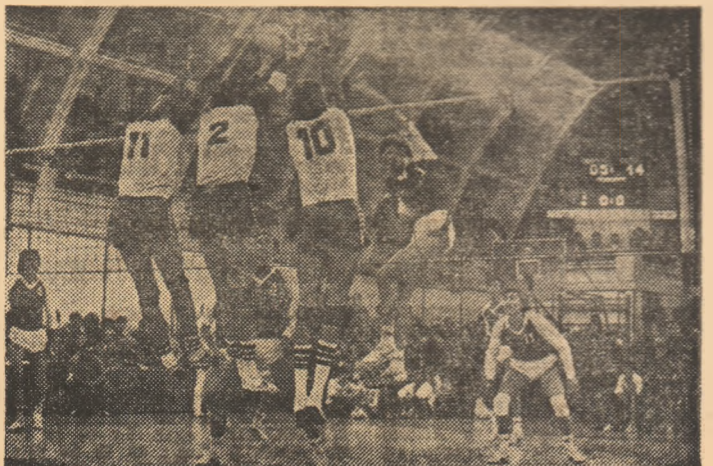
Sorin Pop străpunge blocajul grupat al torinezilor.