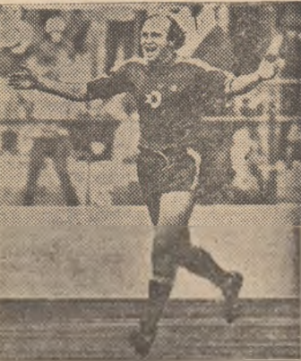
Dieter Hoeness — „decănat“ de vîrstă al lui Bayern München

Ultimele trei locuri ale clasei mentului sînt ocupate de echi-