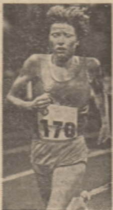
la maraton, probă în care s-a clasat a patra, în 2:27,34.

valoare are performanța de la 5000 m realizată de norvegianca Kristiansen pe pista celebră — nu mai puțin celebrul stadion Bislett. Într-o cursă mai puțin familiară — decamată — femeilor, Kristiansen este prima alergătoare care parcurge cele 13 tururi și jumătate în mai puțin de 15 minute. Întrecînd copios recordul americancei Mary Decker (15:08,26, din 1982), Ingrid Kristiansen (28 ani) a evoluat în vară la J.O. de la Los Angeles. Ea a concursat (așa cum o