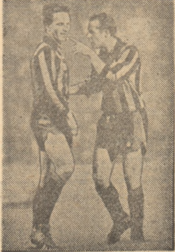
Doi dintre vedetele lui Internațională Milano, vest-germanul Rummenigge și irlandezul Brady.

● Jucătorul brazilian Paulo Roberto Falcao (A.S. Roma), care a lipsit mai mult timp din echipa sa, în urma unei accidentări la genunchi, a reintrat duminică, marcînd golul victoriei în meciul cu Napoli. Iată, însă, că după joc el a acuzat din nou mari dureri la genunchi, iar miercuri s-a deplasat în S.U.A. pentru a fi consultat de un renumit specialist. Se pare că Falcao va fi indisponibil, din nou, mai multă vreme. Un alt jucător străin, care activează în Italia, va fi indisponibil în etapa de duminică. Este vorba de Mark Hateley (A.C. Milan), accidentat la genunchiul drept, în meciul cu Atalanta. Medicii l-au recomandat un repaus complet cel puțin pînă la 13 Ianuarie, cînd echipa sa va înfrînge pe Lazio, la Roma.