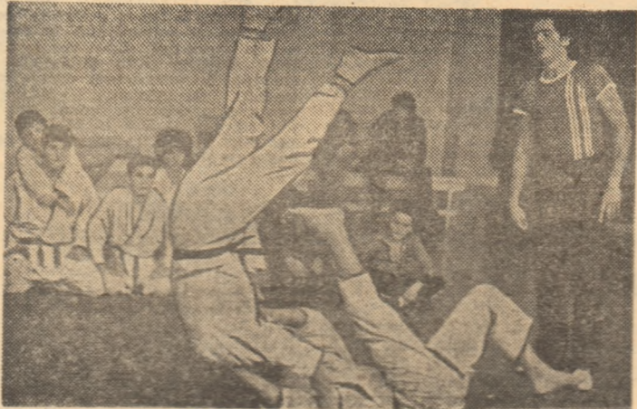
Micii judoka din București, în plină pregătire pentru Festivalul pionieresc de judo de la Tirgoviște

... și tot... te olimpice... licee, cu pre... Educației și... organizat un... de odihnă... consacrate... în spor... Rusea... Paring... alpin... biatlon),... Mare, Căpri... Cimpulung... Neamț... dea și Timiș... -romane... ere - Odor... - Pitești... și sporturi... rz-Băi. În to... sportivi. O... un fel de... și C.C. al... ang Moldove... panți), rez... asociațiilor... de învă... ofesionale, li... re - o ta... în probleme... ale acti... e masă (or... onatelor pe... generalizarea... creații și în... de spațiu... exerciții fi... școlilor etc.).... U.A.S.C.R.,... or funcționa... de schi, de... onare, în ca... ni montane... Băișoara, Va... iș ș.a.) și a... var, Peștera... e, Virful cu... au etc.), pre... pără specială