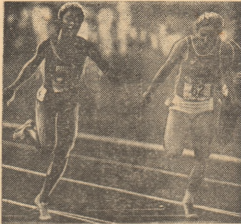
Finisul cursei record mondial la 100 m. în concursul din august de la Zürich, cu Ashford și Göhr în prim-plan