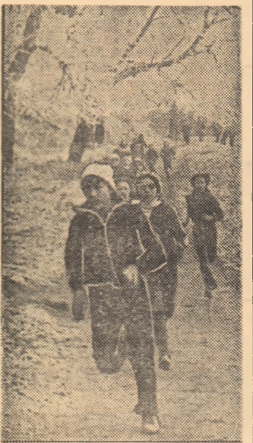
În plină alergare, participantele la „Cupa 30 Decembrie” la cros... Foto: V. CIRDEI — Sibiu

În clasamentele generale — pe echipe — primele locuri au fost ocupate de: Pionierul Sibiu (prof. Nicolae Pampu și