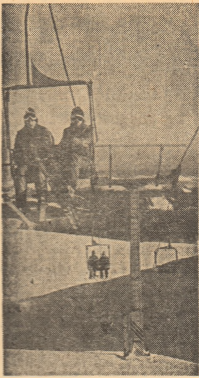
În tot mai multe localități turistice montane, mijloacele de urcare pe cablu sînt un ajutor prețios în activitatea de performanță

„În momentul de față — continuă profesorul Ghiga — anual putem raporta că pînă la 300 de copii se descurcă pe orice pantă de dificultate ridicată”. Da, este un succes! Cum la același capitol al realizărilor poate fi trecut și primul titlu de campioană națională,