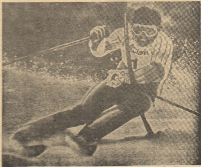
Fotografia noastră îl înfățișează pe Andreas Wenzel, din Liechtenstein, unul dintre cei mai valoroși schiori alpini din lume.

Principalele competiții ale sezonului 1984/85 sînt campionatele mondiale care vor avea loc la Seefeld, în Austria (17-27 ianuarie), probe nordice și la Bormio Santa Catarina, în Italia (31 ianuarie - 10 februarie) probe alpine.