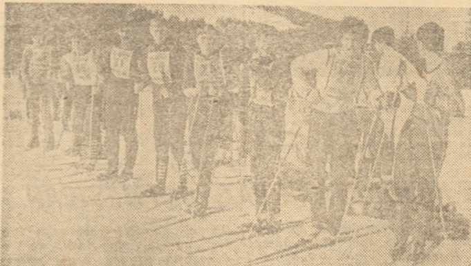
Sus, în Păltiniș, urcă sibienii, dar către sfîrșitul săptămîinii, la întrecerile de schi organizate în cadrul „Daciadei”, vin în această frumoasă stațiune montană sportivi din toată țara. În fotografie, un grup de schiori participanți la „Cupa U.T.C.”.

Cea de a XII-a ediție a „Trofeului Iașului” la handbal pentru echipe feminine. Intrecerea excelent organizată de C.J.E.F.S. Iași s-a bucurat de un frumos succes, la care și-au adus contribuția divizionarele „A” TEROM Iași, Textila Dorobanțul Ploiești, Confecția București, Mureșul Tg. Mureș (seria I), Hidrotehnica Constanta, A.E.M. Timișoara, lotul reprezentativ de junioare și