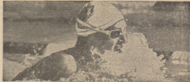
Canadianul Alex Baumann, dublu campion olimpic și recordman mondial

● „La Gazeta dello Sport” din Milano a stabilit lista celor mai buni baschetbaliști europeni din 1984: 1. Arvidas Sabonis (19 ani, component al formației Jalgiris din Kaunas). 2. Juan Antonio Epifanio (Barcelona), 3. Juan Corbalan (Real Madrid).