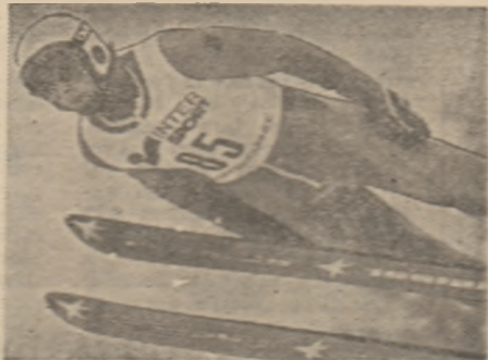
Campionul olimpic Jens Weisflog într-un zber spectaculos.

Proba de combinată nordică îi are în prim-plan tot pe sportivii din țările nordice (Norvegia și Finlanda în principal), și trebuind să reziste, însă, presiunii performențelor din Uniunea Sovietică, R. F. Germană și R. D. Germană. Să mai amintim că la mondialele de la Seefeld câștigătorii au trecut cu două se-