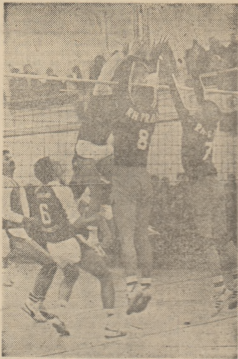
Dinamovistul Gileanu încearcă să evite apărarea la fileu a praghezilor