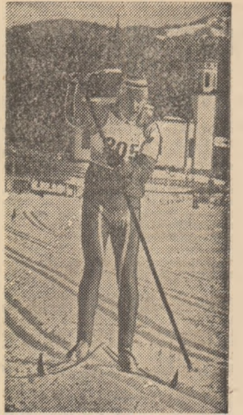
Gunde Svan (Suedia). - S-a născut la 12.1.1962, la Falun, 187 cm, 75 kg. Anul trecut, la Sarajevo, a fost campion olimpic la 15 km, 4x10 km, medaliat cu argint la 50 km și cu bronz la 30 km. A fost, de asemenea, câștigător al „Cupet mondiale” la schi fond

În altă ordine de idei, s-a comunicat că numărul țărilor afiliate la federația internațională de hochei pe gheață a a-