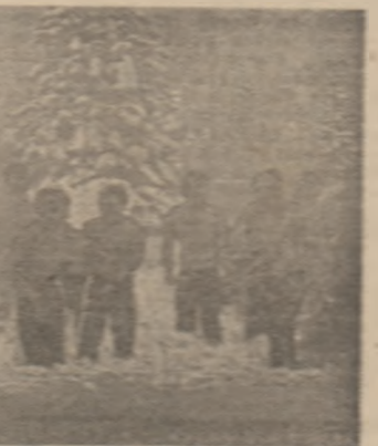
Local reprezentativ se încumetă la o „baie” în zăpadă...

și-au spus încă ultimul cuvînt! Mai au chiar șanse reale să urce pe podiumul marilor competiții.