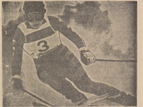
Schioara elvețiană Michela Figini domină cu autoritate întrecerile „alpine” din actualul sezon.