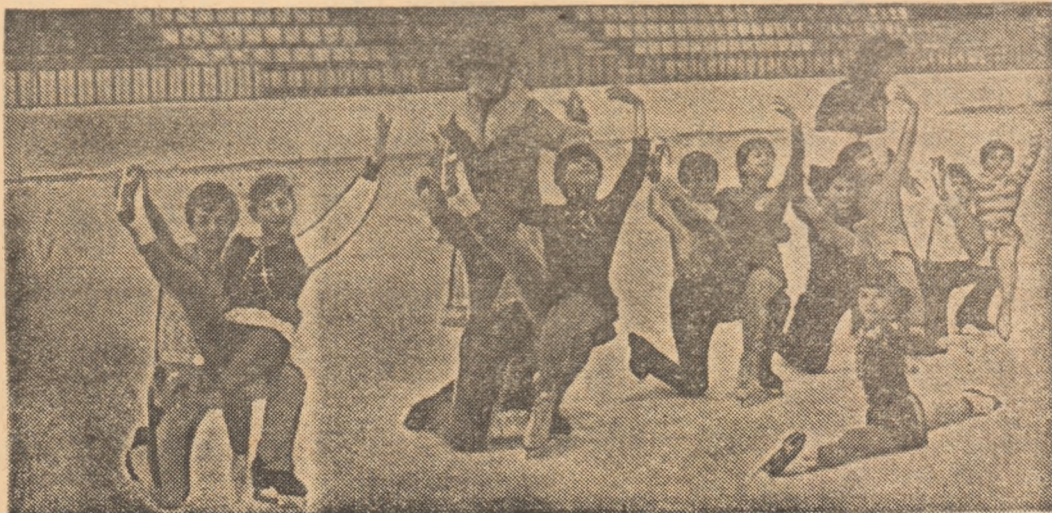
Oră de coregrafie la Centrul olimpic — ICEMENERG