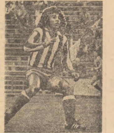
Hugo Sanchez, cel mai bun fotbalist mexican.