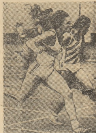
Marita Koch o întrece pe Marlies Göhr în cursa de 100 yarzi.