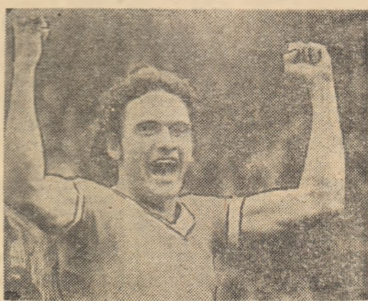
Elkjaer-Larsen, unul dintre cei mai valoroși jucători danezi