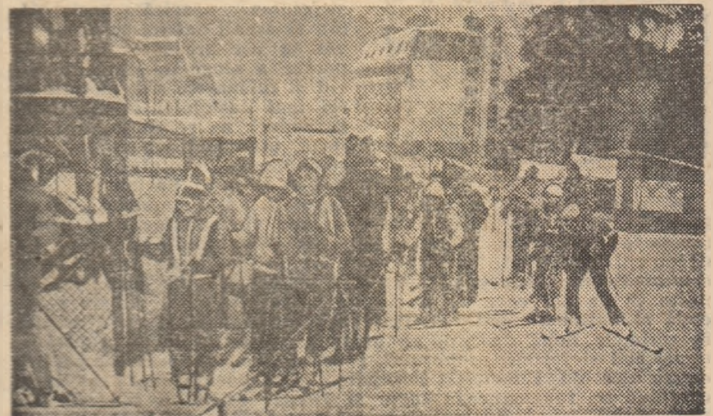
Nerăbdări spre pirtie - secvență de la „Festivalul pionieresc al sporturilor de iarnă” de la Vatra Dornei.

După-amiază, după desfășurarea manșei a 2-a, pe primele locuri în „Cupa pionierilor” la schi alpin, slalom uriaș - fete (11-12 ani): 1.