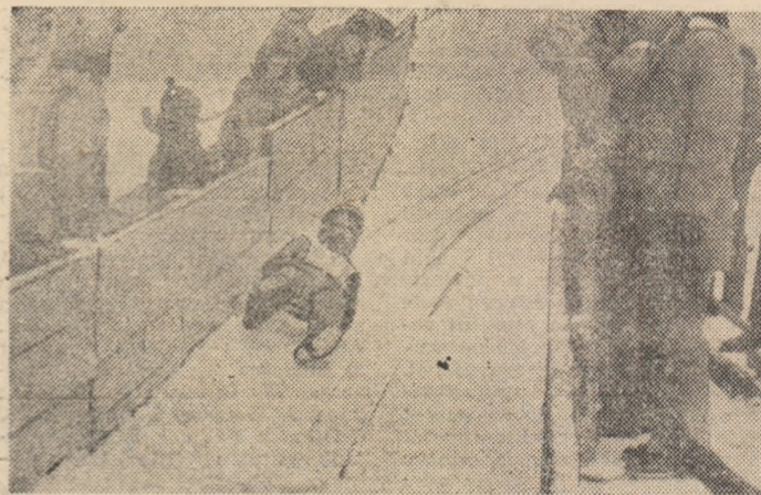
Pirtia de sanie a pus la încercare toată măiestria concurenților la „Cupa pionierilor” de la Vatra Dornei.

Entuziaste întreceri în cadrul „Cupei pionierilor”