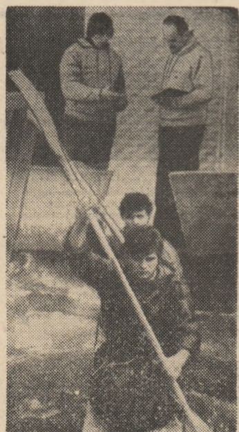
O fotografie în premieră: Ivan Patzaichin, acum în postură de antrenor, alături de Radu Huțan.

Apa circulă în ritmul brațelor lui Giura, Ticu, Titu, ale celorlalți. Pe chipuri, pe trupuiri curge sudoarea, pe măsură ce loviturile de padelă sau pagae se string cu zecile, apoi