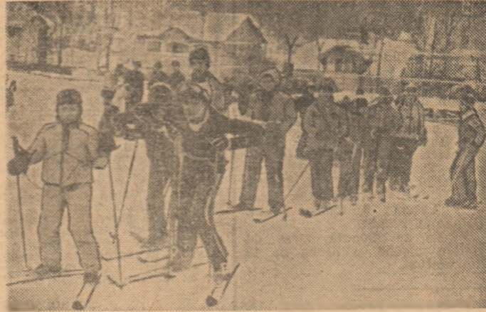
Pe pirtia de la Vatra Dornei, un grup de pionieri înainte de plecare spre locul de start.